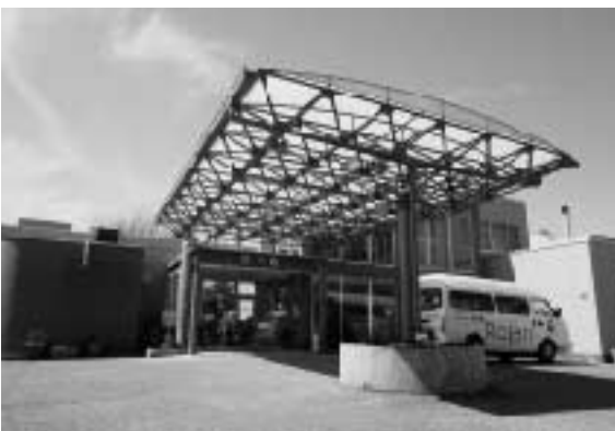
実習先:障害者支援施設 誠光園

これはただ単に「テクニック」ではありません。勿論技術も必要ですが、相手を思う気持ちや技術よりも重要だと思いました。愛がなければ、無に等しい。自分の愛の無さに落ち込むこともありましたが、これからの自身の課題も見つけることができた実りある実習でした。