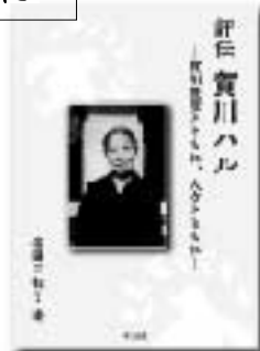
不二出版、2018年9月刊行 A5判・604頁、5,800円+税 2017年度 公益法人賀川事業団雲柱社 第二回出版助成を受けて刊行

本書は、こうした賀川ハルの本格的な研究書としては嚆矢となるものであり、今日の女性の生き方について、そしてキリスト教と社会の関わりについて、多くの示唆を与えてくれることと思います。ぜひご一読を。(職員 高橋伸幸)