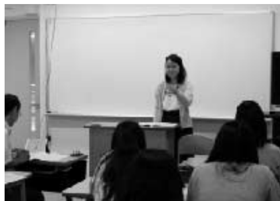
介護実習報告会での様子