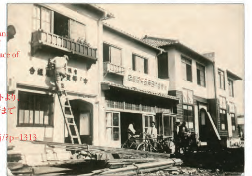
震災後の日本における宗教的ミニストリーの理論と実践

Science for Ministry in Japan The Theory and Practice of Christian Ministry in the Face of Natural Disasters (2014-16)