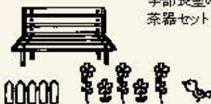
学部長室の茶器セット

学部長室で執務開始。今は朝から夜まで授業、会議出席、学生との面談、準備など全部ここでやっています。