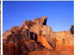
グレートジンバブエ遺跡 (世界遺産)